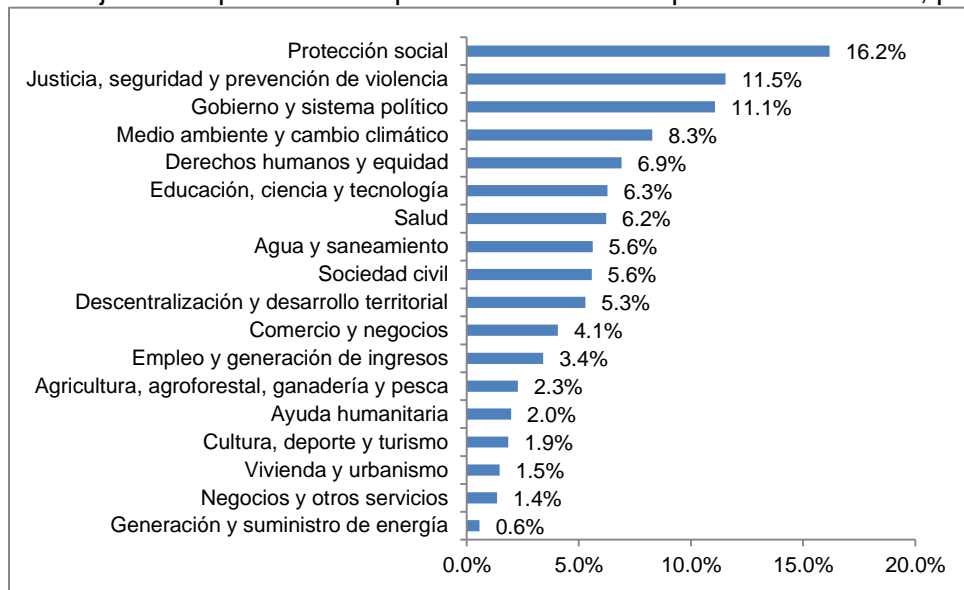
Gráfico 2. Porcentaje de cooperación comprometida durante el período 2009-2014, por sector CAD

Fuente: Elaboración propia con base a información del VMCD.