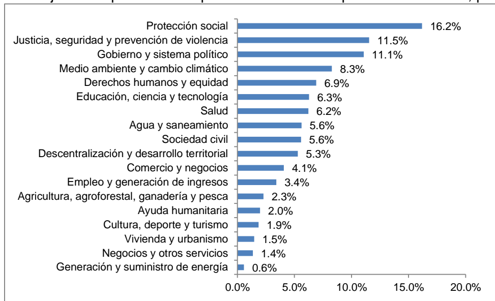
Gráfico 2. Porcentaje de cooperación comprometida durante el período 2009-2014, por sector CAD

Fuente: Elaboración propia con base a información del VMCD.